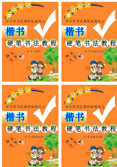
图1 楷书硬笔书法教程

据我们十多年书法教育经验和所接触的情况来看，很多家长第一困惑的问题就是：小孩子在老师的指导下，就会写得很好，一旦离开老师，回到使用阶段，在学校书写、日常使用就被“打回原形”，作业书写、考试又回到“不工整”“大小不一”“提笔忘字”等的“原始状态”。其实，这不是老师不用心的问题，也不是学生本身努力的问题，而是老师与学生之间的沟通、互动的问题。说白了，就是教与学的问题。