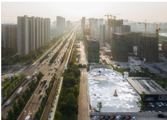
图1 White Upland（未来峯前场）

该项目是俞挺的Wutopia lab工作室在中国湖州吴兴区设计的一个房产售楼中心的销售前场。如图1所示，这个3300平方米的钢铁花园是俞挺团队第一次把建筑、景观、室内、照明、装置艺术综合在一起而创作的魔幻现实主义场所。他把一个销售中心的前场变成一个周边地区都可以共享，甚至整个湖州人民都可以使用的开放的超现实主义花园，它就是一个反Generic City（广谱城市）宣言。