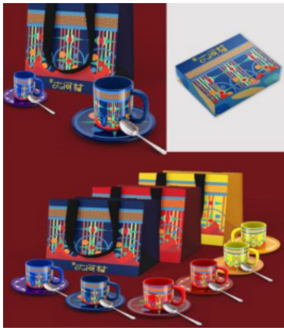
图1 “大河村”文化茶杯系列

河南博物馆创新性地采用了“大河村遗址”作为文创灵感来源，制作了一系列“大河村”文创产品，其中“大河村”文化茶杯系列是代表之作，如图1所示。这个系列茶杯采用了“大河村遗址”出土的各种