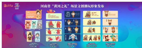
图2 “黄河之礼”场景文创潮玩形象设计